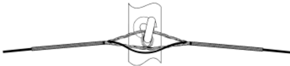
Fig.: Exemplu de montaj